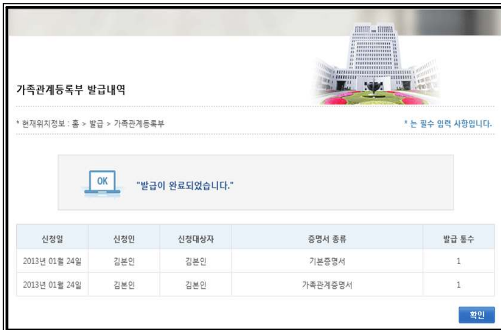
<그림8> 발급 내역