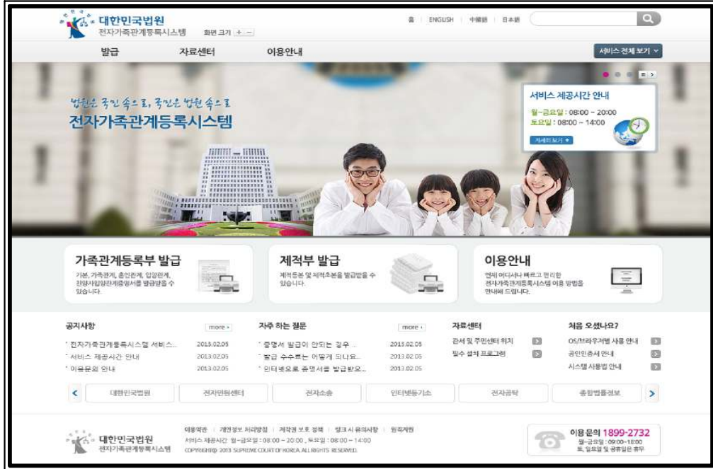
<그림1> 메인 화면